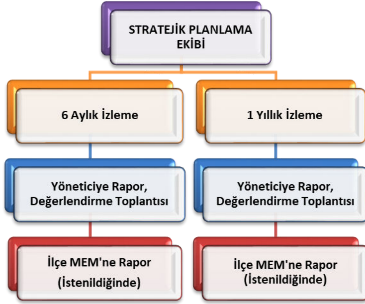
Şekil-1 Stratejik Plan İzleme ve Değerlendirme Modeli